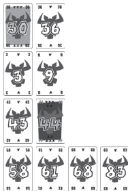
Obr. 4: Ukazuje čtyři řady po třetím kole.

Příklad: Byly zahrány následující karty: 3, 9, 68 a 83. „3“ je nejnižší karta a musí být jako první umístěna. Nelze ji ale zařadit do žádné řady. Hráč, který ji zahrál, vyprázdní jednu řadu. Vybere si druhou řadu a vezme si „37“ (protože je tam jen jedna kráva). Jeho „3“ je teď první kartou druhé řady. Hráč s kartou „9“ ji teď může položit do této řady vedle „3“.