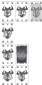
Obr. 2: Ukazuje čtyři řady po prvním kole.

„14“ je nejnižší a bude se zařazovat jako první. Podle prvního pravidla patří vedle „12“, stejně tak i „15“ zařadíme do této řady vedle „14“. „44“ může podle prvního pravidla patřit do řady za čísla 15, 37 nebo 43. Podle druhého pravidla ale musí být zařazena za kartu „43“. Karta „61“ patří podle druhého pravidla do čtvrté řady vedle „58“.